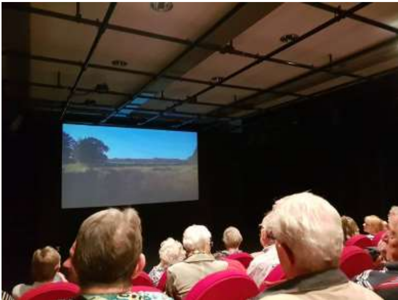
Deze foto is op vrijdag 22 juni 2018 gemaakt door Sophie Fleur Verbiesen v.d. Ven

De belangstelling voor deze filmavond was overweldigend. Ook bij de extra avond was de voorstelling in korte tijd uitverkocht.