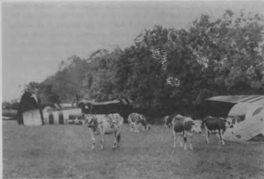
Enkele niet-gestolen koebbeesten .

In juli 1942 was het weer raak. De krant schreef toen: "De gemeente Rosmalen, waar in den loop der laatste maanden zooveel runderen clandestien zijn geslacht,