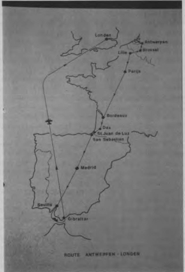
Komeetlijn Antwerpen - Gibraltar.

en Spanje in Gibraltar te komen. Deze grootste en belangrijkste geheime ontsnappingsroute voor ontvluchte Franse krijgsgevangenen en neergeschoten geallieerde vliegtuigbemanningen was ontstaan in 1941. Deze lijn werd georganiseerd door een Belgisch meisje, te weten Andrée de Jongh, onder de naam De Komeet . Zij wist met haar organisatie 810 piloten veilig naar Engeland te doen terugkeren en bovendien nog tachtig geheime agenten. Ook zij werd door verraad gearresteerd en kwam in het concentratiekamp Ravensbrück. Zij overleefde echter alle martelingen en keerde in 1945 terug naar België. In Noord-Brabant, Limburg en Zeeuws-Vlaanderen waren diverse illegale grensovergangen voor de piloten. De