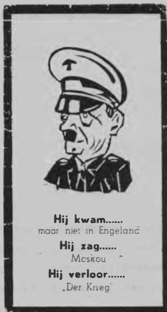
Een bidprentje van Adolf Hitler.

van 't vieze geld ontdoan. Waarmee toch zooveul naorigheid We hebben deurgestaon. En weg is ok ut standverschil. Is dè nie heel wè wèrd? Want wie tien centen rijker was.