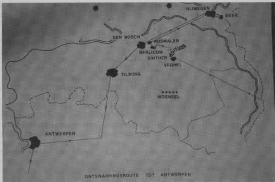
Ontsnappingsroute tot Antwerpen.

De luchtoorlog heeft ook boven Nederland - vooral in de laatste oorlogsjaren - een zeer zware tol geëist, niet alleen voor de geallieerde en Duitse luchtmachten, maar ook voor de Nederlandse bevolking. Tussen 10 mei 1940 en 5 mei 1945 kwamen op Nederlands grondgebied ruim 6000 vliegtuigen door oorlogshandelingen neer: bijna 2000 Duitse toestellen, zoals Stuka's, Junkers en Messerschmidts en ruim 4000 geallieerde vliegtuigen, zowel Engelse Spitfires, Lancasters, Halifaxes, Mosquito's als Amerikaanse vliegende Forten, enz. Hierbij kwamen in totaal om: 9000