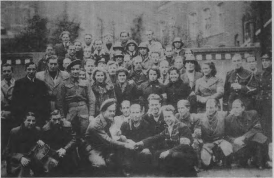
K.P. Margriet. MTS-Koopmansplein, 's-Hertogenbosch.