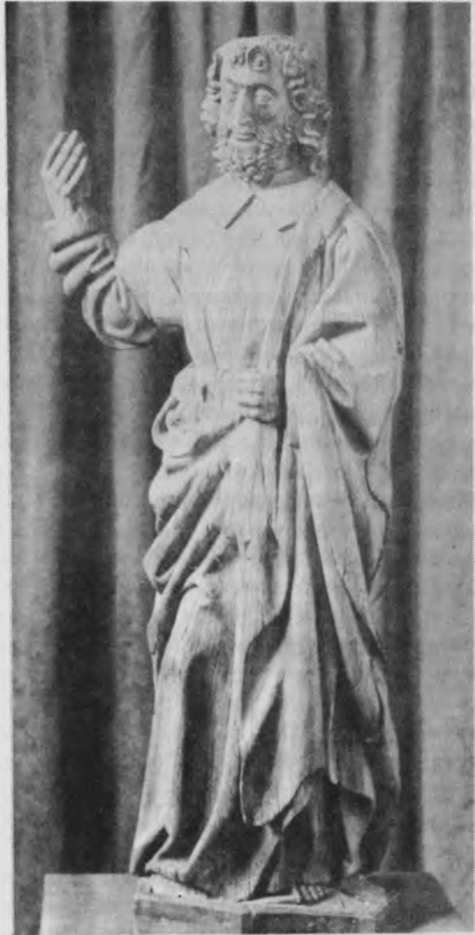
Mannelijke Heilige. Coll. Rijksmuseum. Noord-Nederlands, ca. 1520. Eikenhout. Afkomstig van Coudewater.