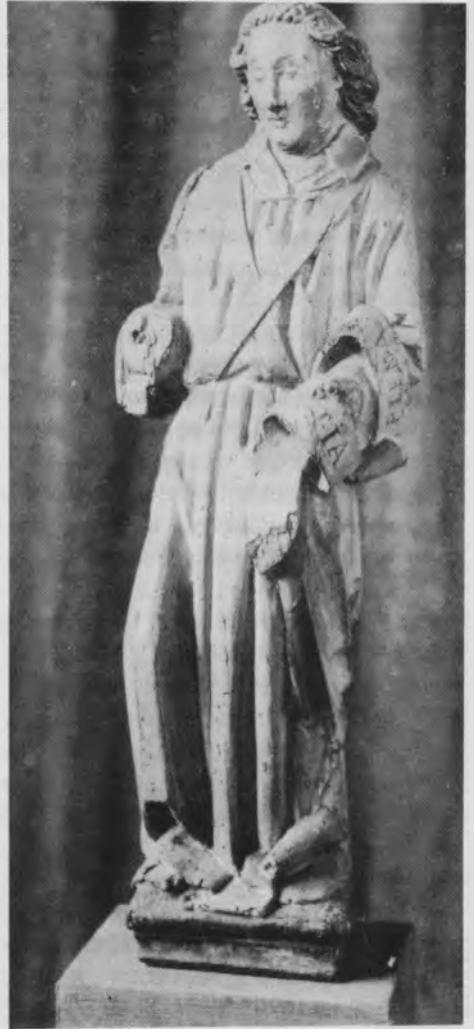
Engel Gabriël. Coll. Rijksmuseum. Nederlands ± 1500. Afkomstig van het klooster Coudewater.