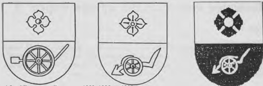
Afbeelding voorstellen NCWV 1989, 1993 en 1998.

lijk pagina 25 en 27 wordt voorgesteld om het wapen van Rosmalen te corrigeren, en wel met de blazoenering: " Doorsneden; I in zilver een vierblad van keel, geknopt van goud; II in keel een ploeg van zilver. Het schild gedekt met een gouden kroon van drie bladeren en twee parels. " De wapentekening is (behoudens de kroon) in beide rapporten op dezelfde wijze weergegeven (zie eerste afbeelding).