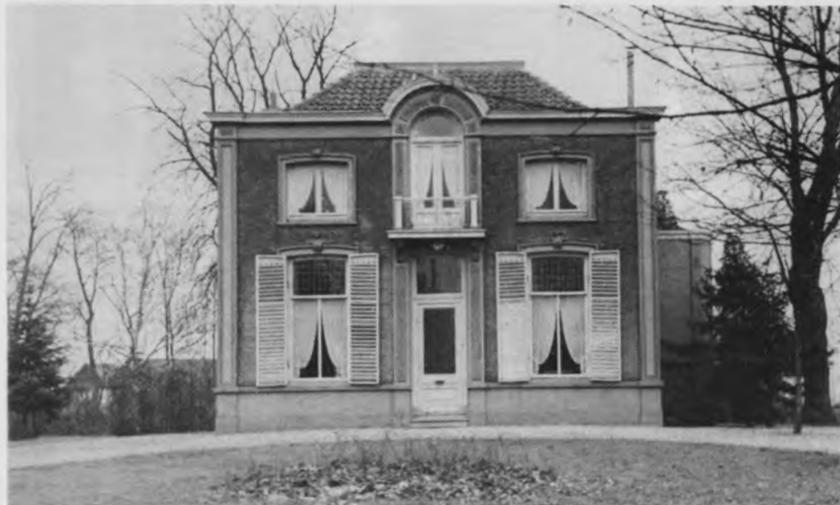
Hoogoord omstreeks 1930.