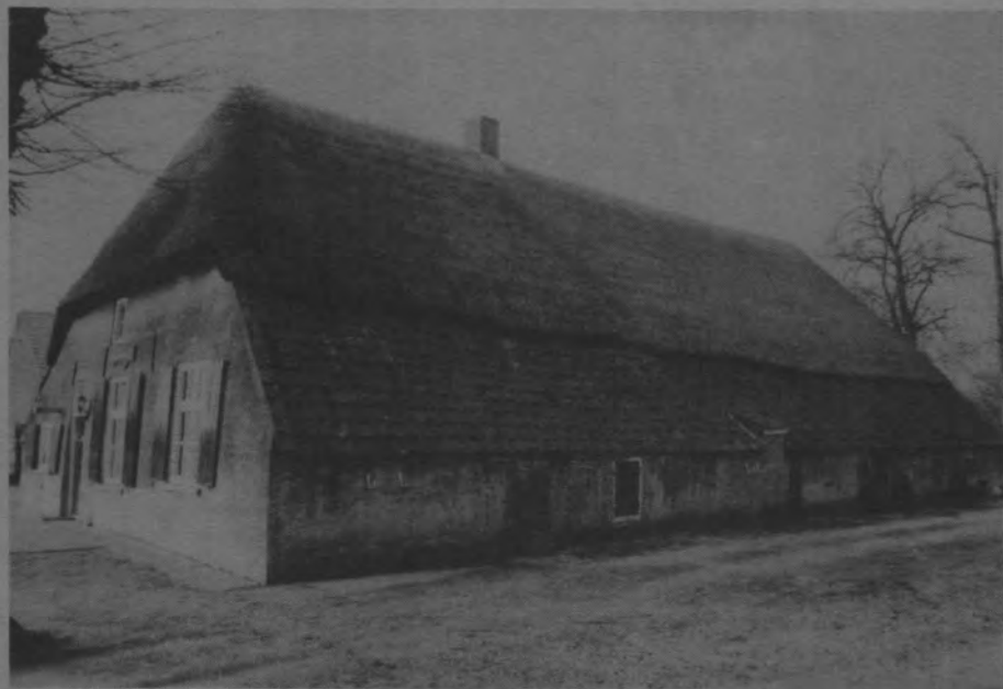
Twee keer de Duinsche Hoeve. Coll. Heemkundekring Rosmalen.