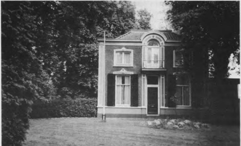
Een zeer recente foto van Hoogoord.