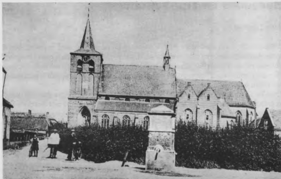
De Sint-Lambertuskerk van vóór 1930. Nog te zien is de boerderij van voor de bouw van de St.-Josephschool, de dorpspomp, de nis aan de zuidzijde met een kruis (Calvarieberg genoemd) en het schoolhuis aan de oostzijde.