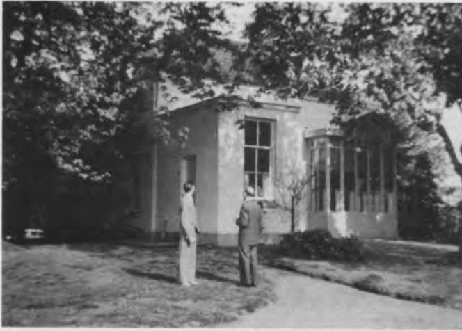
Hoogoord aan de zuidzijde voor de verbouwing.