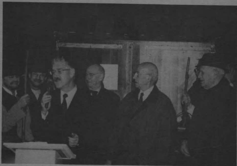
De opening van de Rosmalense kerststal op 16 december 1998. Zie ook pag. 38-40.