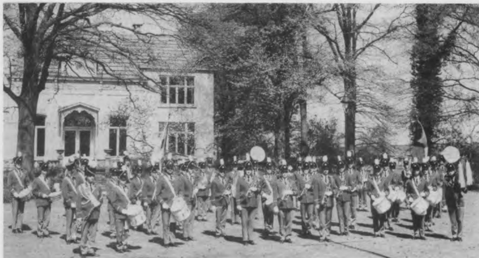
In 1978 werd deze foto gemaakt van de Drumband Hintham voor villa Zuiderbosch, tegenwoordig Wijnhandel Verlinden, te Hintham.

legenheid van de viering van zijn eerste plechtige H. Mis, feestelijkheden die in feite drie dagen hebben geduurd. Voorafgegaan door de drumband van de Jeugdcentrale te Hintham en vergezeld door ondermeer de leden van het erecomité en feestcomité begaf de eerwaarde pater, die onlangs te Valkenburg tot priester werd gewijd, zich naar de stijlvol versierde ouderlijke woning aan de Graafsebaan. Buurtgenoten zorgden voor een feestelijke entourage door van hun huizen de vlaggen uit te steken. Deze buurtgenoten hadden zich overigens ook op andere wijze niet onbetuigd gelaten. Zo hadden 20 van hen gedurende 2 dagen hun auto ter beschikking gesteld. Het was dan ook een imposant gezicht, de stoet die de neomist op de Eerste Paasdag naar de parochiekerk van de H. Laurentius bracht. Harmonie St.