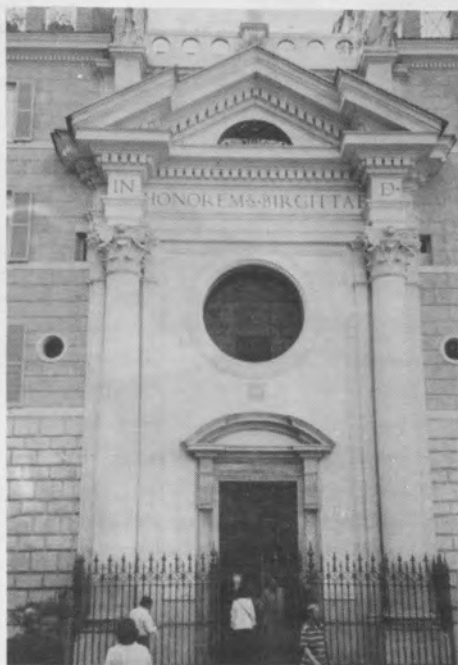
De kerk van de Birgittinessen aan de Piazza Farnese in Rome.