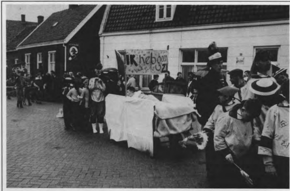
De eerste Zandhazendurpse optocht in de Dorpsstraat