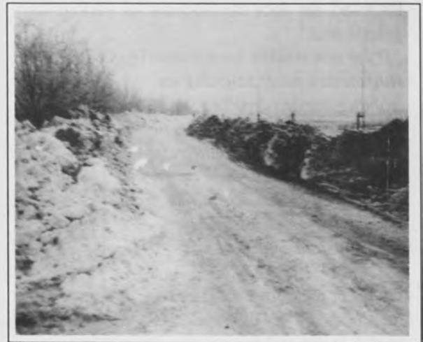
1963: De verbindingsweg naar de boerderij van Jo van Nuland is weer open.