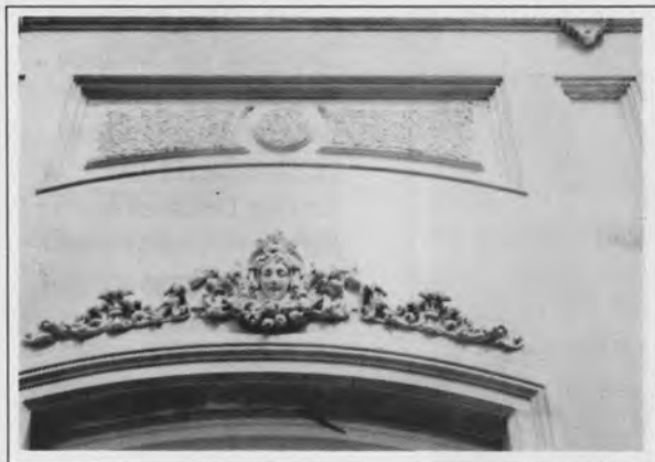
Ornament boven een van de ramen van de villa

genomen en pas in 1962 vervangen door elektrische lantaarns. Het heeft ondergetekende nog al wat moeite gekost deze palen te achterhalen. Zij lagen bij een schroothandelaar in Tilburg, die ze per kilogram gewicht aan ons verkocht heeft. (Nu zijn het dus monumenten!)