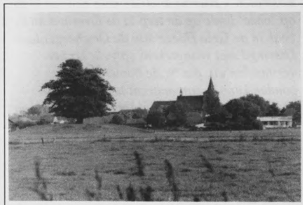
Deze foto maakte ik zo'n 30 jaar geleden vanuit de Polder van der Eigen in Rosmalen-Noord

boom kunnen zijn, een plaats waar recht werd gesproken, voordat er van een kloosterstichting sprake zou zijn? De naam 'Rosmalen' is te herleiden tot de oer-woorden 'rausa' en 'malla', een 'gerechtsplaats in het riet'. Een plek op de overgang van zand naar klei, zou dat geen ideale plek kunnen zijn geweest om recht te spreken? In de Duitse plaats Kalkar aan de Rijn staat midden op een plein eveneens een lindeboom, waarvan de traditie wil dat deze in het begin van de 16 e eeuw als gerechtsboom is geplant. Die boom moet het echter in grootsheid overtuigend afleggen tegen de Rosmalense boom !