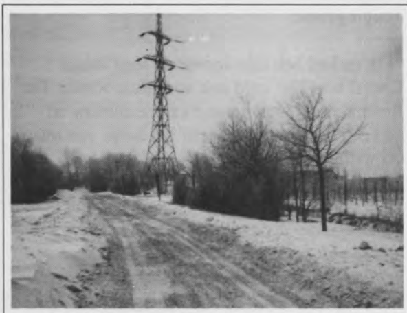
Nogmaals de Burgemeester Jhr. Von Heijdenlaan tijdens de januari-winter van 1963.