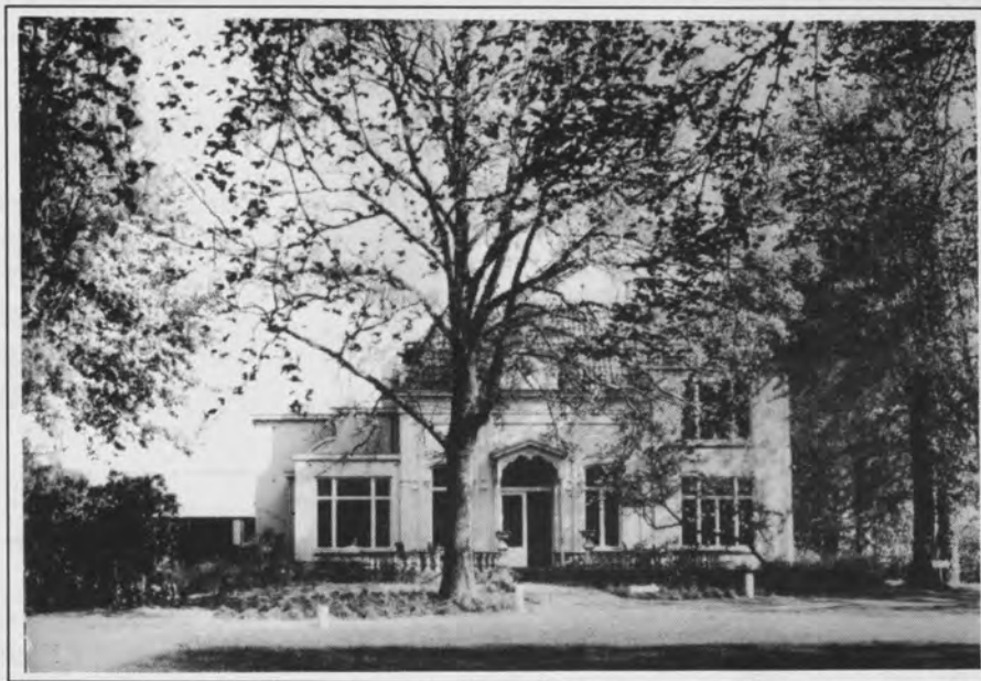
Ansichtkaart van Villa Zuiderbosch van Wijn Verlinden