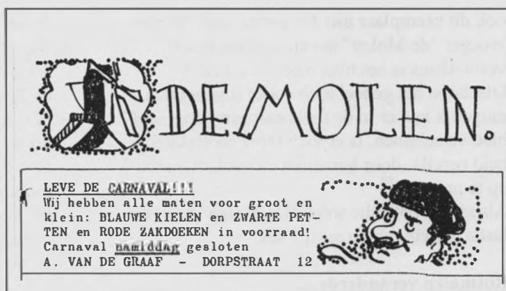
“De Molen”, februari 1960