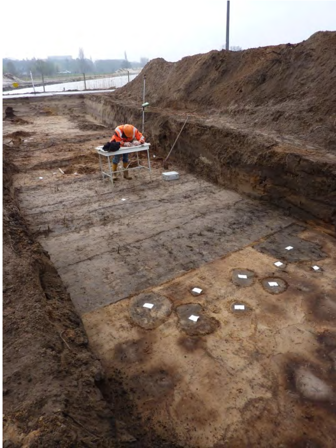
Greppel Burg. Jhr von Heijdenlaan

een voor mij overigens nieuwe naam! Op basis van het historisch kaartmateriaal werd verwacht dat hier resten van stellingen en een schans uit de Tachtigjarige Oorlog zouden liggen. De Overdijk is een hoog liggende landweg die mogelijk hoorde bij de stelling uit 1629, toen Frederik Hendrik 's-Hertogenbosch belegerde. Zoals u weet moesten de Spaansgezinde machthebbers door deze aanval het veld ruimen. Met de graafmachine zijn diverse proefsleuven gegraven om te zoeken naar de sporen van de schans en de stellingen in de ondergrond. De archeologisch interessante lagen bleken echter zo goed als verdwenen. Dat heeft te maken met zandwinning die hier halverwege de 20 e eeuw plaatsvond. Jammer! Wel werd in het veld een kleine metalen kanonskogel aangetroffen, maar het is niet duidelijk of die uit 1629 dateert.