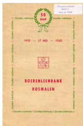
Het gouden jubileumboekje van de Boerenleenbank Rosmalen.