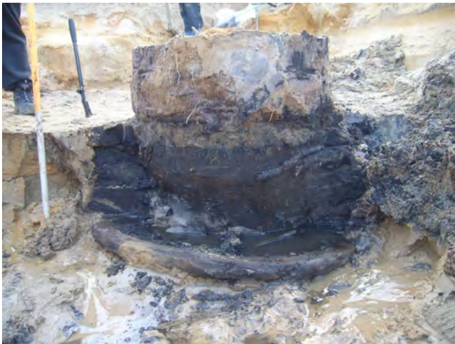
Waterput op de Heinis