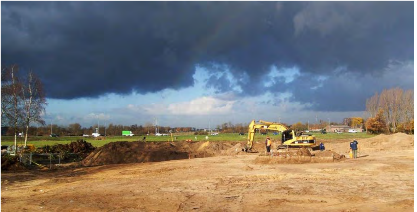
Archeologen aan het werk op de Heinis