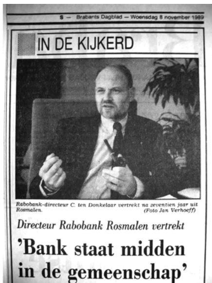
Links: Brabants Dagblad 1 december 1984. Rechts: Brabants Dagblad 8 november 1989