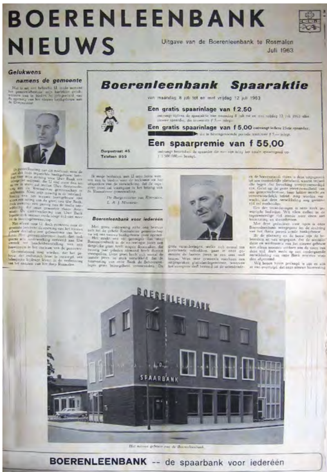
"Boerenleenbanknieuws juli 1963"