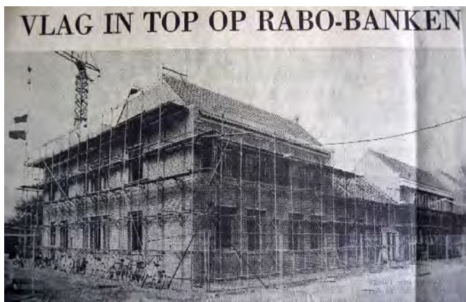
Brabants Dagblad 10 mei 1984.

Pas op 31 januari 1985 was de officiële opening. Tege-