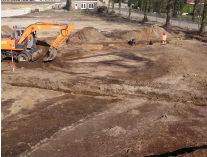
Aanleg werkput Burg. Jhr. von Heijdenlaan