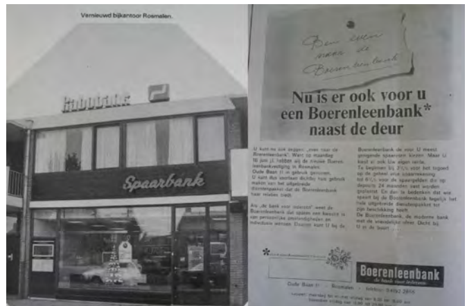
Het hulpkantoor aan de Oude Baan en de bij de opening horende advertentie in 1969.

Tegelijk met het bijkantoor van Hintham werd ook het bijkantoor aan de Oude Baan in 1977 grondig gemo-