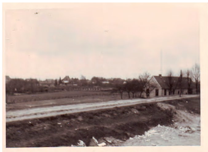
Foto van de Hinthamse dijk, ca 1965 gemaakt door Emile Eijskens voor zijn woning Ernst Bagelaarstraat 3