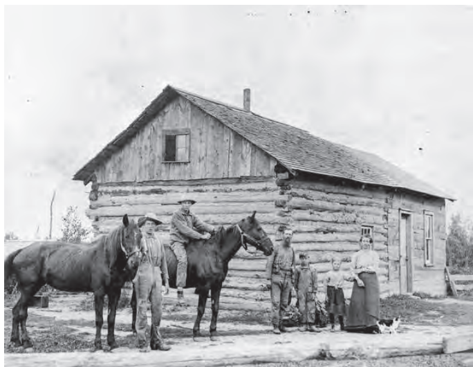
Typisch Nederlandse hofstede in Little Chute, V.S. 1855