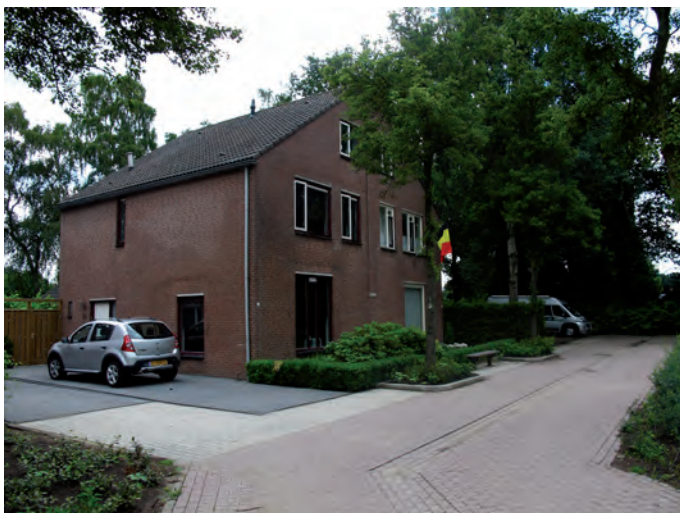
Peelhoeven 23 (rechts) en 24, juni 2016