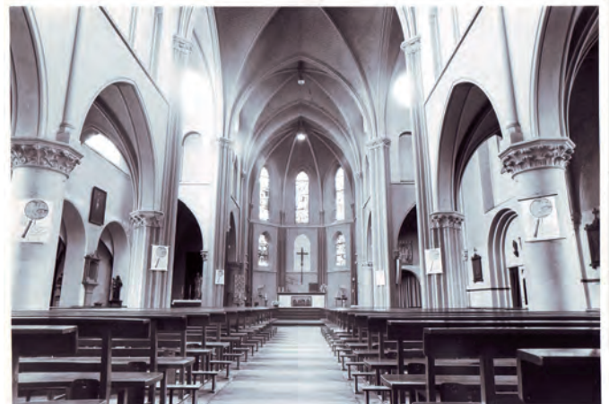
Interieur van de Annakerk voor renovatie, periode 1956-1991

van een inventaris (=lijst van archiefstukken) zijn alle vijf parochie-archieven toegankelijk gemaakt. Ruim 20 strekkende meter papier herbergt een schat aan materiaal, van kerkkoren tot broederschappen, van parochiebladen tot parochieel onderwijs. Om één concreet voorbeeld te noemen: in het archief van de H. Moeder Anna is de ledenadministratie van circa 1950 tot circa 1966 bewaard gebleven. Op systeemkaarten heeft de toenmalige pastoor, naast adres en samenstelling gezin, nauwgezet bijzonderheden genoteerd inzake beroep en opleiding van zijn parochianen. Het overgrote deel van alle materiaal – documenten, kaarten, foto's en films – kan vanaf nu zonder beperking in de studiezaal van het Stadsarchief aan de Bloemenkamp (achter de Arena) worden ingezien.