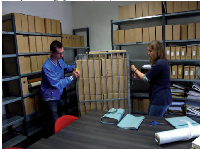
Verhuizing van de parochie-archieven door medewerkers Stadsarchief in de Laurentiuskerk, 29 juni 2016