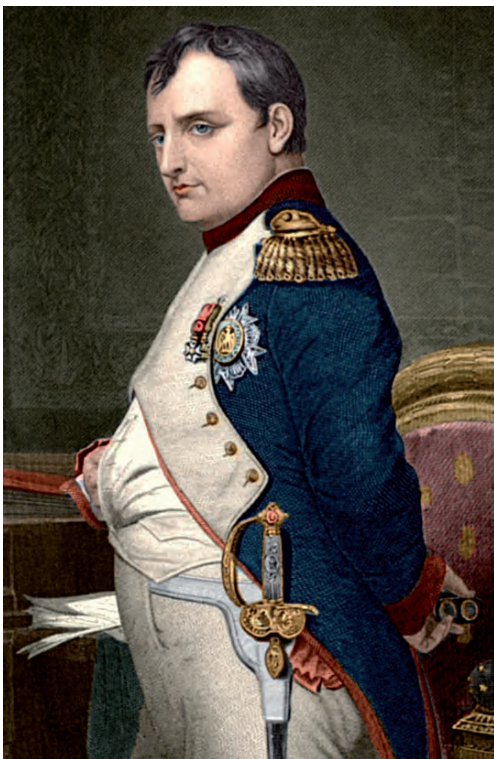
Portret van Napoleon (naar Paul Delaroche)