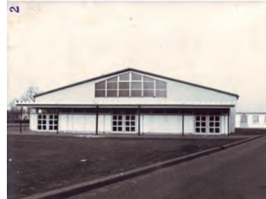
Noodkerk van de Paulusparochie aan de Van Broeckhovenlaan, gerealiseerd 1959

Het archief van de Paulusparochie is bewaard gebleven van 1959 tot 1975.