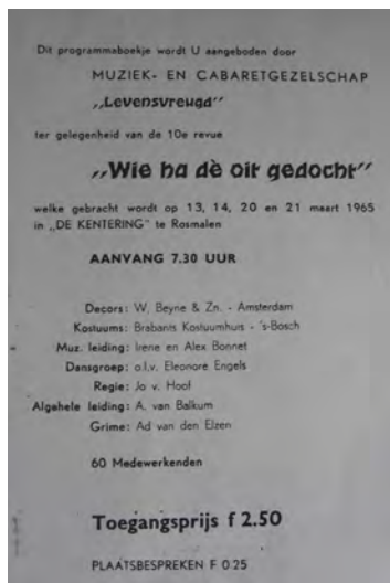
Programmaboekje: "Wie ha dè oit gedocht". Rosmalen collectie Henk de Werd in het Stadsarchief van 's- Hertogenbosch.

In 1965 was Levensvreugd klaar voor haar tiende revue. "Wie ha dè oit gedocht" leverde veel spontane reacties op. Aan de hooggespannen verwachtingen werd ruimschoots voldaan.