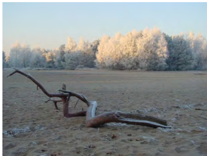
De Rosmalense zandverstuiving, ook prachtig in wintertooi

Gelukkig is er ook nog een mooi wandelgebied aangelegd en is het aangrenzende bosgebied nog steeds intact gebleven. Ook is onze prachtige zandverstuiving nog steeds een recreatieplek voor mens en dier, groot of klein, jong en oud.