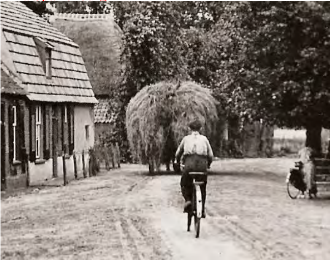
Mooi geladen hoogkar