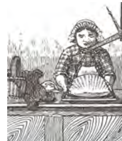
Bij de botermijn