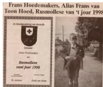
Brabants Dagblad. Rosmalen collectie van Henk de Werd in het Stadsarchief van 's-Hertogenbosch.