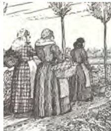
Op naar de botermarkt

proeven te doen met o.a. rundvet. Mège-Mouriès mengde rundvet met ondermelk. Door gebrek aan grondstoffen werd later gezocht naar plantaardige en dierlijke oliën. Nu zijn er allerlei variaties van margarine in de handel.