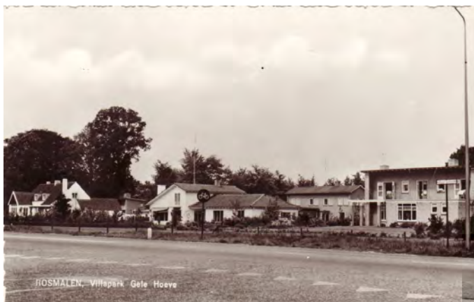
Ansichtkaart van de Gele Hoevelaan. Rosmalen collectie van Henk de Werd in het stadsarchief van 's-Hertogenbosch.

de Mortel op de begraafplaats bij de Lambertuskerk. Mevrouw Van de Mortel – de la Court werd beschermvrouwe van de in 1922 opgerichte harmonie St. Cecilia alhier.