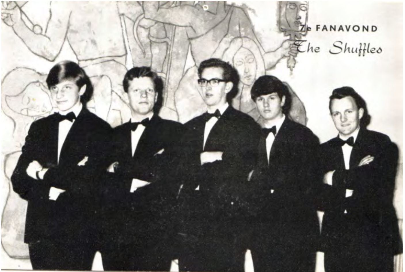
The Shuffles. Rosmalen collectie van Henk de Werd in het Stadsarchief van 's-Hertogenbosch.

elfde revue! Die elfde revue is er nooit gekomen.