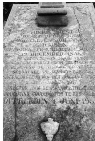
Graf rector Zwijzen op het kerkhof van Coudewater.